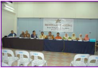
Mesyuarat Agung Kali ke 17 pada 25/4/2008