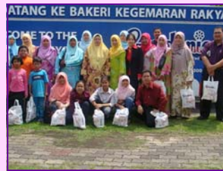
Lawatan ke kilang Gardenia Shah Alam anjuran Biro Rehlah dan Riadah pada 26/5/2008