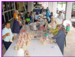
Ihya Ramadhan (Ceramah mingguan, solat zohor & tazkirah, Bubur Lambuk) sepanjang bulan Ramadhan.