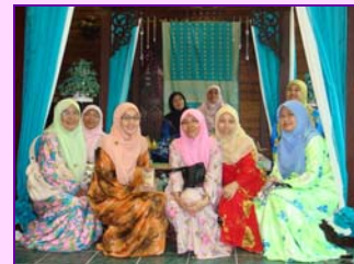
Lawatan ke kraftangan Malaysia pada 8/8/2008.