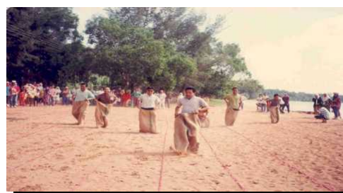
Berbagai-bagai aktiviti diadakan