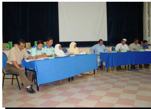
Berpersatuan membentuk peribadi yang mulia

dilihat dengan berpersatuan kita akan bersatu, teguh dan kuat. Dengan ini kita boleh menyuarakan apa saja melalui Persatuan.